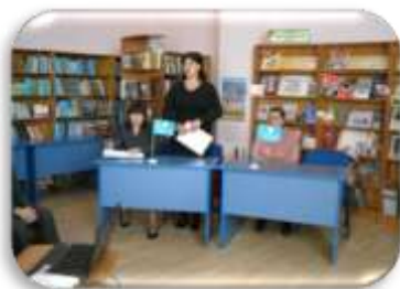
информина «Грани мира»