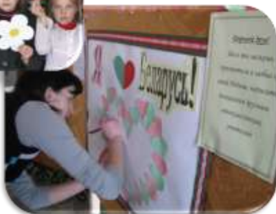
акция «Я люблю Беларусь!»