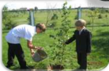
акция «Посади дерево»