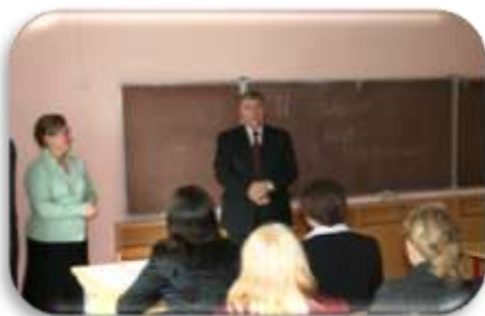
«И помнит мир спасённый...»