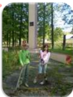
акция «Никто не забыт, ничто не забыто»